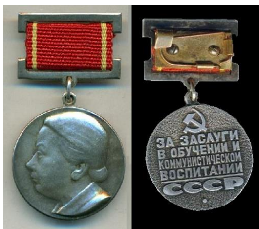
Премия имени Н. К. Крупской (за особые заслуги в области распространения грамотности)

Идея искоренения безграмотности оказалась близкой многим, поэтому годы с 2002 по 2012 были признаны десятилетием грамотности. Был утвержден план международных мероприятий, координатором которых стала ЮНЕСКО. Учреждены несколько премий, вручаемых за самые выдающиеся успехи в борьбе с неграмотностью.